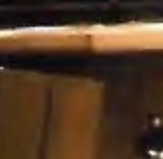
森上 聖恵香 (フルート)