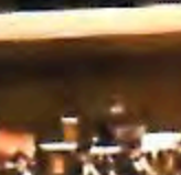
森上 聖恵香 (フルート)