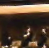
森上 聖恵香 (フルート)