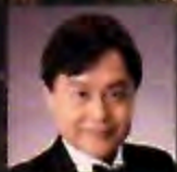
土師 雅人 (テノール)