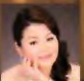
温井 聖恵香 (ソプラノ)