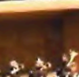
森上 聖恵香 (フルート)